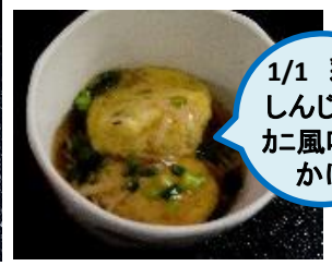
1/1 彩りしんじょうかニ風味館かけ